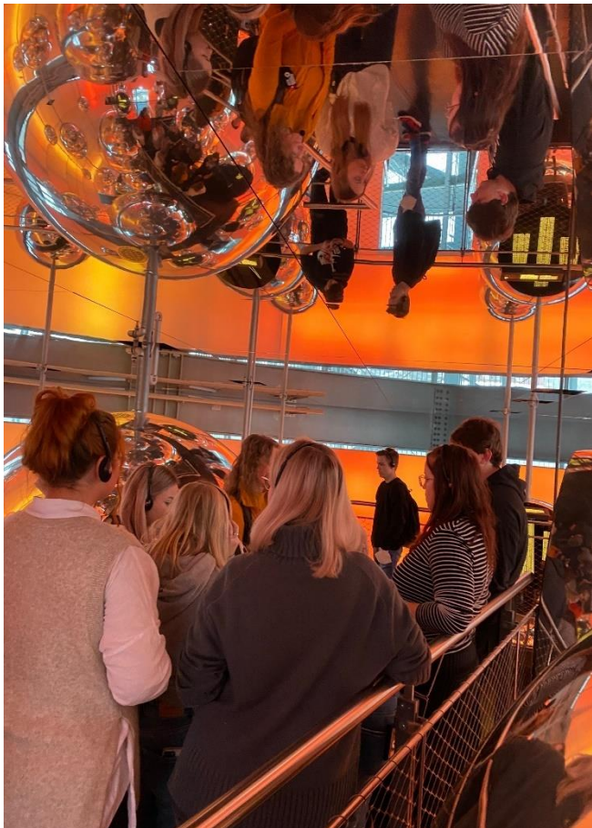
Obr. 21,22 - Exkurze v Voest Alpine v Linci