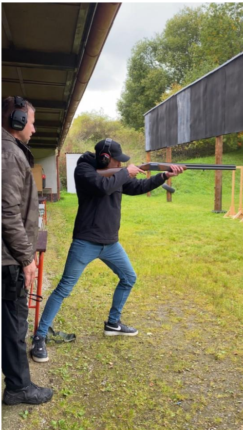
Obr.17- Kurz střelecké přípravy BS2