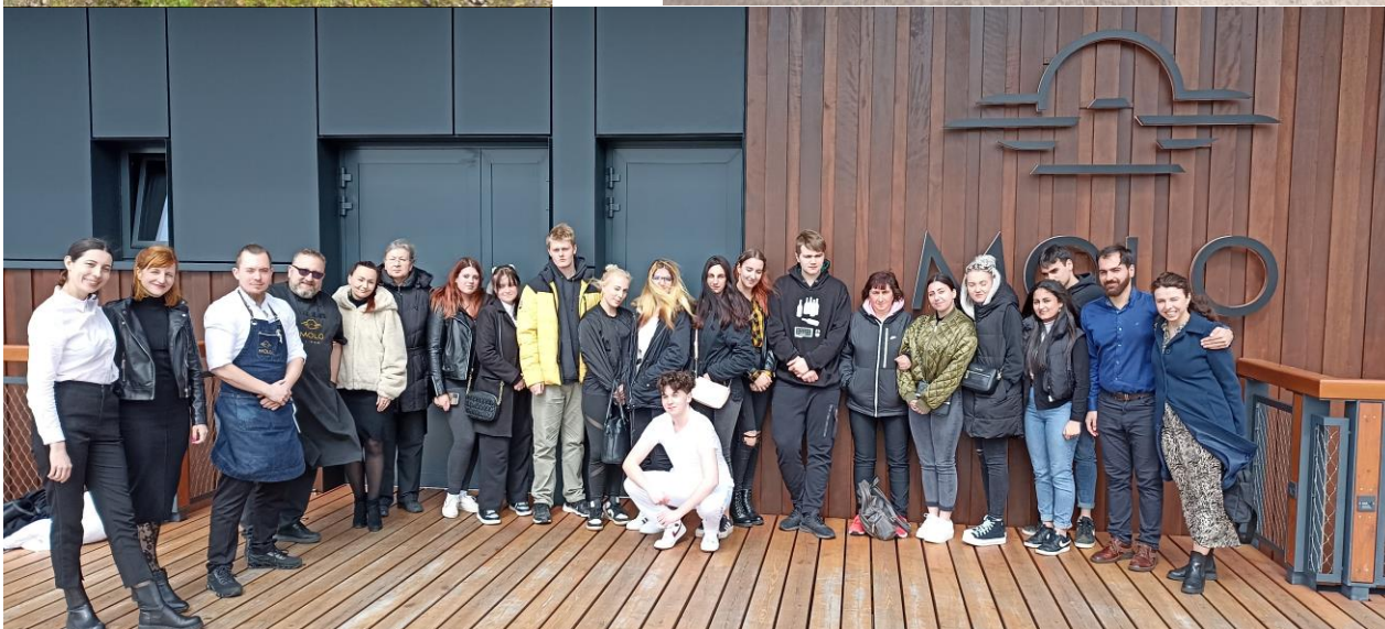
Obr. 19, 20- workshop v Molo Lipno pro obor Kuchař- číšník