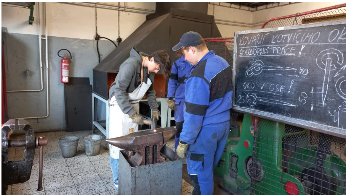
Obr. 24, 25, 26 –Projektový den pro ZŠ – Řemeslo má zlaté dno