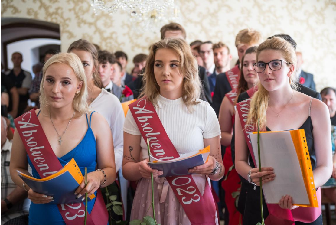
Obr. 6,7,8,9– Předávání výučních listů v obřadní síni města Kaplice