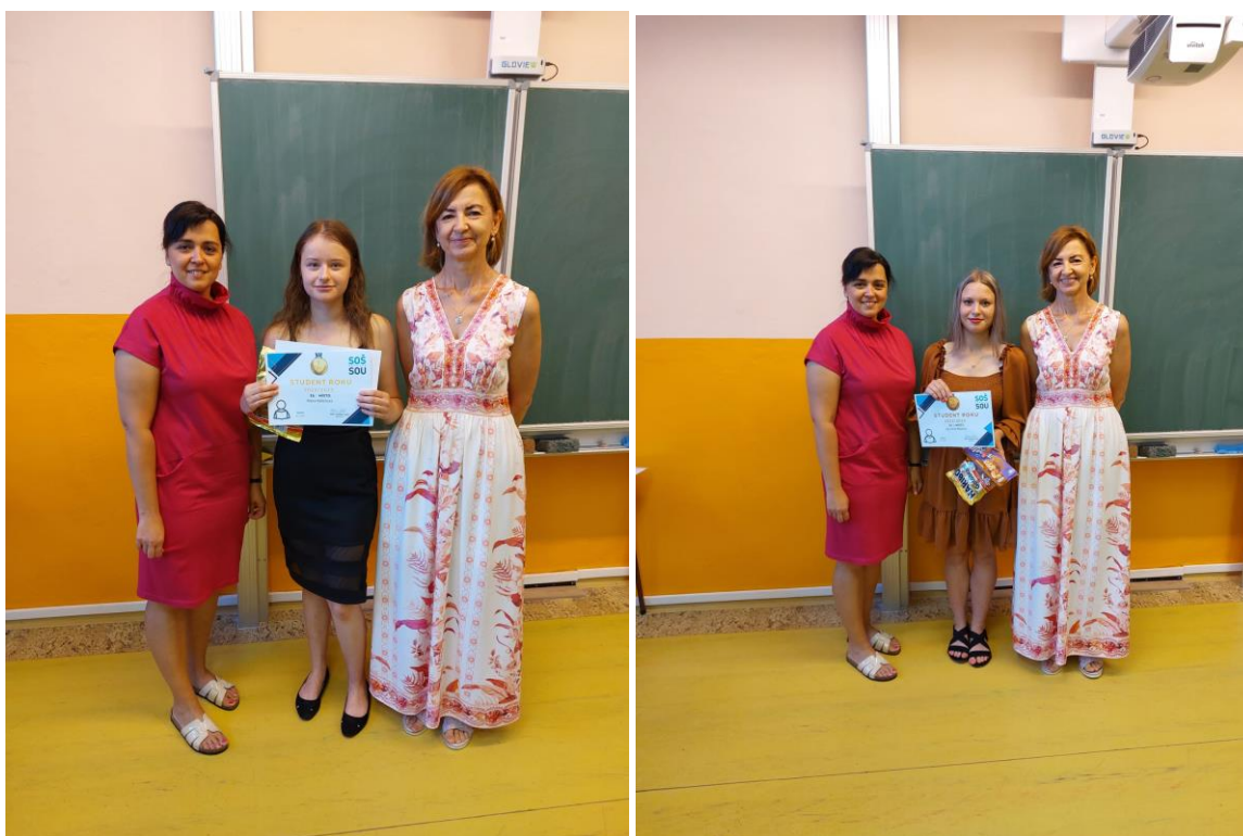
Obr. 11, 12, 13 – Studenti roku 2023