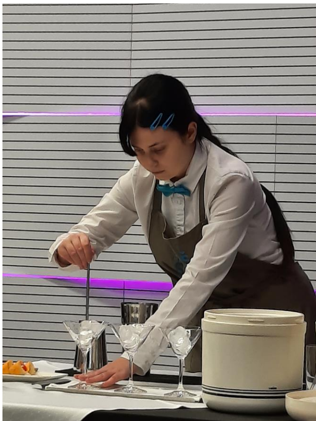
Obr. 17 –Brněnský vánoční pohár

Během školního roku 2022/2023 se podařilo zorganizovat mnoho školení, přednášek, workshopů, kurzů. Také zapojit žáky do top gastronomických témat, a to za podpory odborníků z praxe, Jihočeské hospodářské komory a za podpory vedení školy.