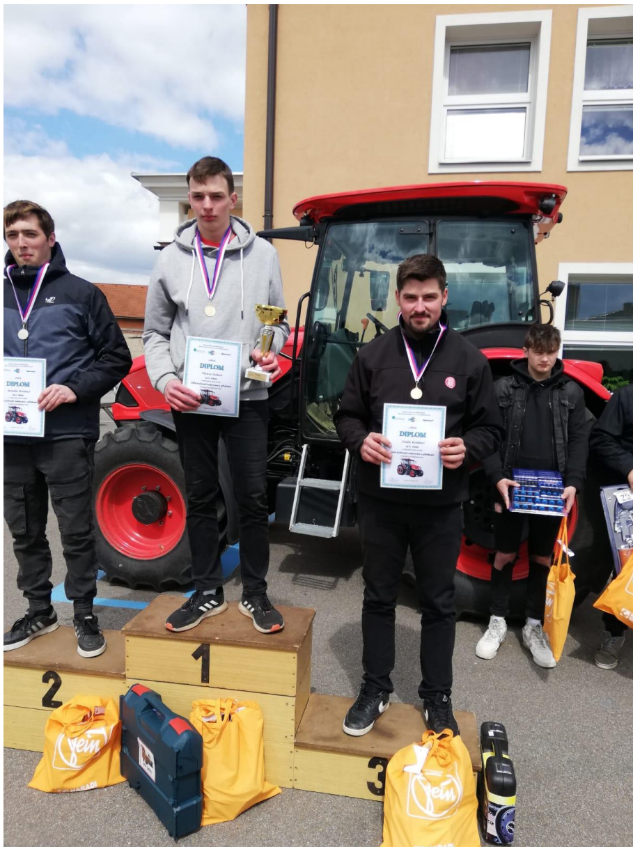
Obr. 3 – Jízda zručnosti, oblastní kolo