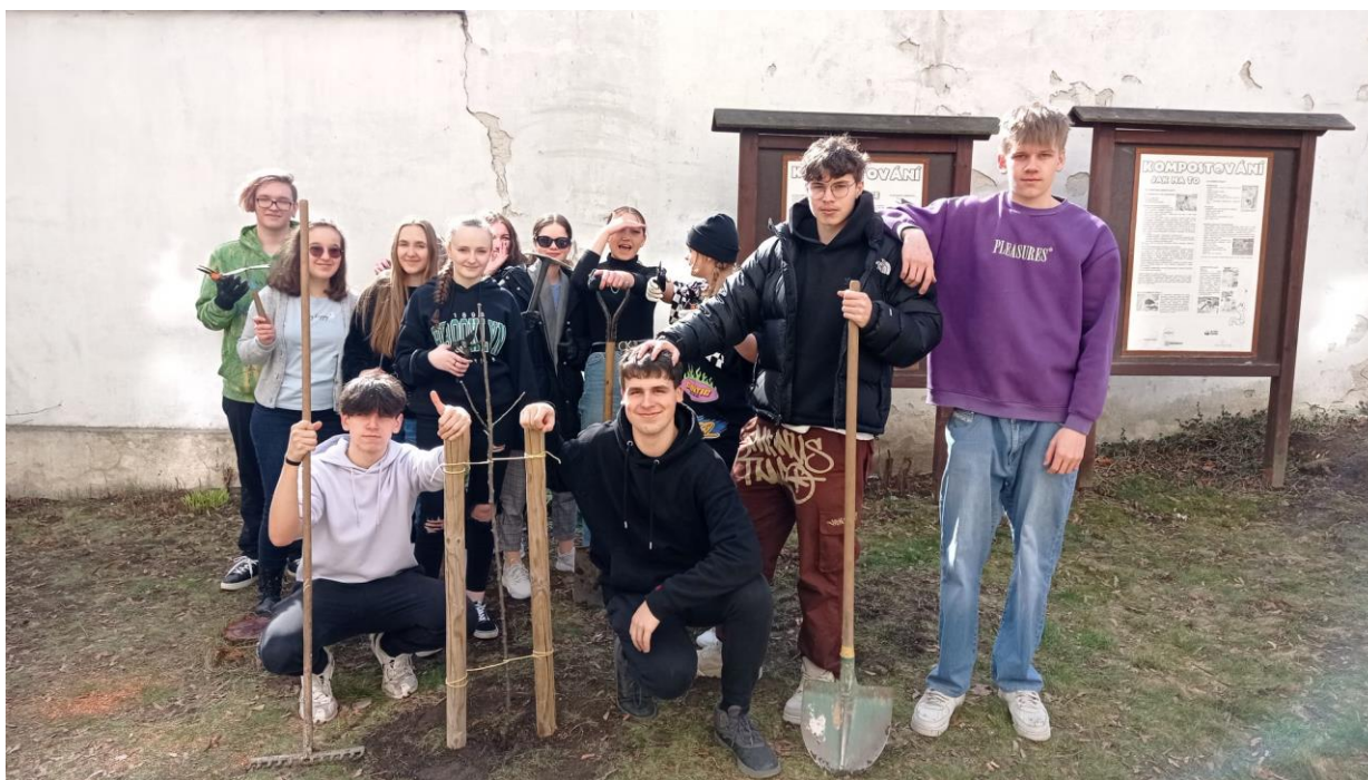
Obr. 27 - Sazení stromu poznání na SOŠ

Studenti SOŠ i SOU se aktivně zapojili do výsadby „Stromu poznání“, která proběhla v rámci připravovaných oslav 70 let středního školství v Kaplici. Tato aktivita byla provázána s tématem biodiverzity a významu stromů v krajině.