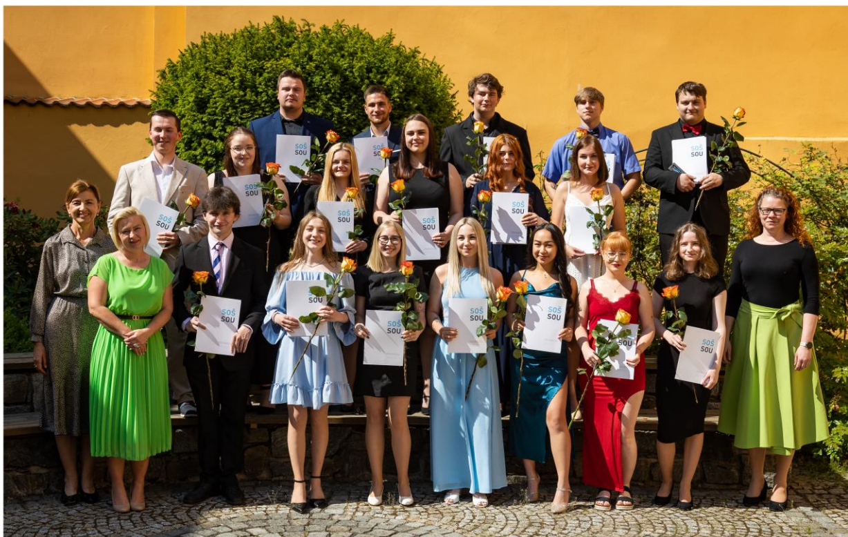
Obr. 5 - Absolventi OA4, BS2