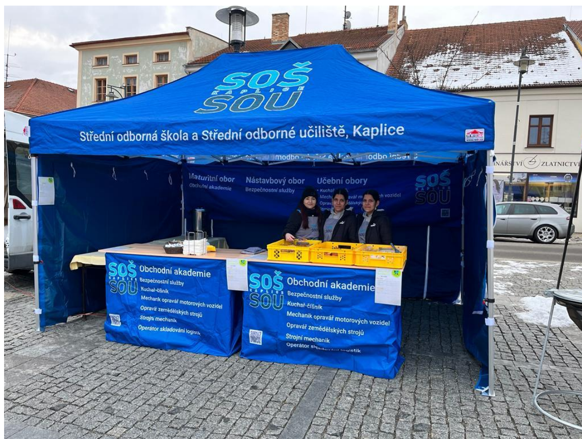
Obr.21– Kaplický Masopust

Pravidelně se zúčastňujeme Burzy škol v Českém Krumlově a výstavy Vzdělání a řemeslo v Českých Budějovicích, na kterých prezentujeme obory vzdělání, které lze na naší škole studovat.