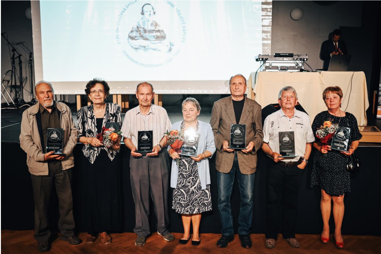
Obr. 1, 2– ocenění pedagogové